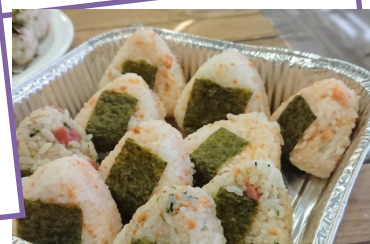
飯團 還有更多選擇.....